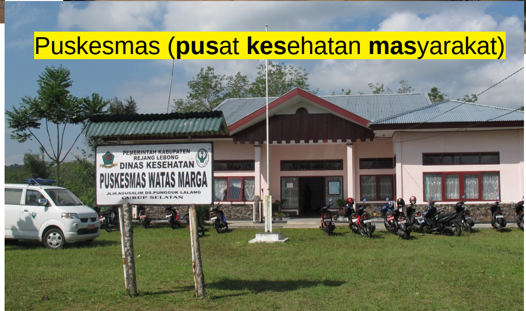
Puskesmas (pusat kesehatan masyarakat)