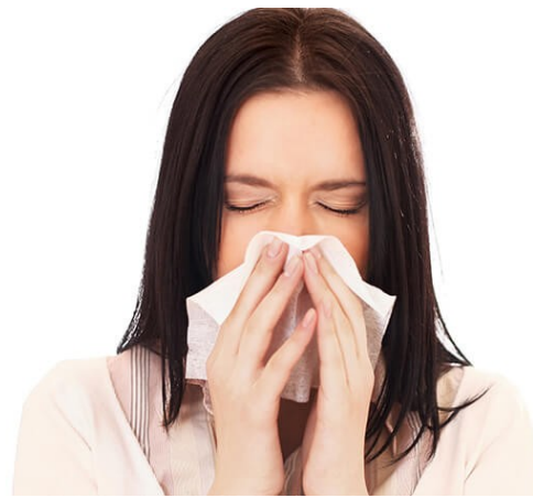
Flu , pilek